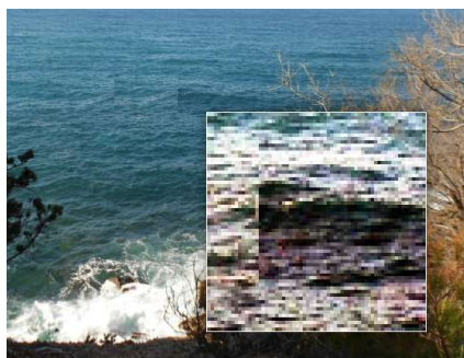
On décèle un montage